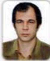
AHMET ÖN MECLİS ÜYESİ