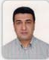
MEHMET ÜNSAL BAŞMAÇ MECLİS ÜYESİ