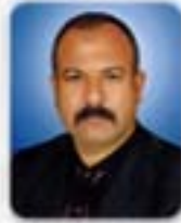
SABAHATTİN KEÇİK MECLİS ÜYESİ