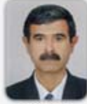
HASANTOKLUÇ MECLİS BAŞKAN YRD.