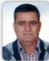
DEVEDÜRKAN MECLİS ÜYESİ