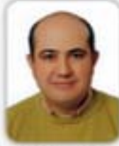
HAKAN BODUR MECLİS ÜYESİ