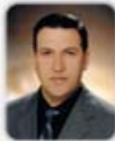
NURETTİN ÇETİNER MECLİS ÜYESİ