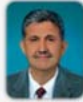
NURETTİN BODUR MECLİS ÜYESİ